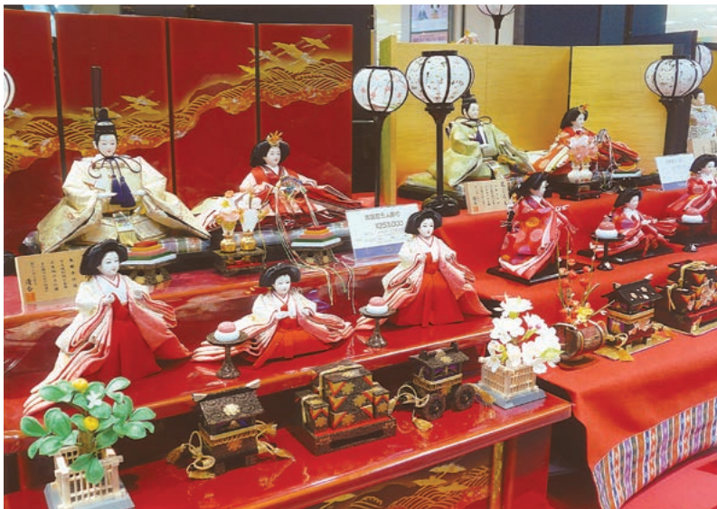
雛祭商戦たけなわ