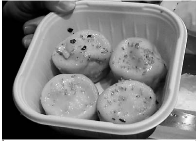
王府井(ワンフーチン)の小籠包

ン)の焼き小籠包(ショーロンポー)である。正宗生煎包(マサムネサンチエンパオ)という。上海の小籠包らしい。 ワンフーチンは、中華街大通りに面している。加賀町警察署の入り口から中華街の方向に目をやると見えるのが、「善隣門」。ここをまっすぐ三〇〇メートルほど歩くと道の右側に見えてくる。普段は大勢並んでいるが、店員の手際がよく、どんな列は捌けていく。大粒の焼き小籠包四つで四八〇円。割り箸をもらって店の前の道でつく。 小籠包はいきなり口にいれてはならない。熱いスープが皮の中にあたり入っているからだ。まずは歯で小さく穴を空け、肉汁をすする。これが美味しい。そのあと、火傷に気をつけながら、厚めの皮と肉を、少しずつ口に入れていく。寒い日など暖まる。