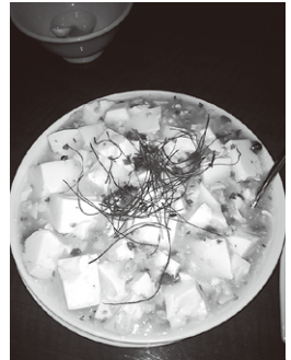
心龍の「白麻婆豆腐」

れば、心龍。白い麻婆豆腐が食べられます!!美味 しいのかな……と半信半疑で食べましたが、これ が美味しい!!辛いのは辛いのですが、さっぱりと した辛さです。ここのお店は、香辣水ギョーザも おすすめ★何とも言えない芳しい香りと水餃子の もっちり感が絶妙です。是非お試しあれ。