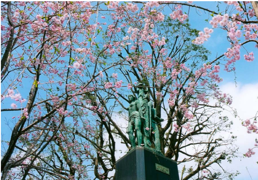
希望の春に… (東京・練馬)